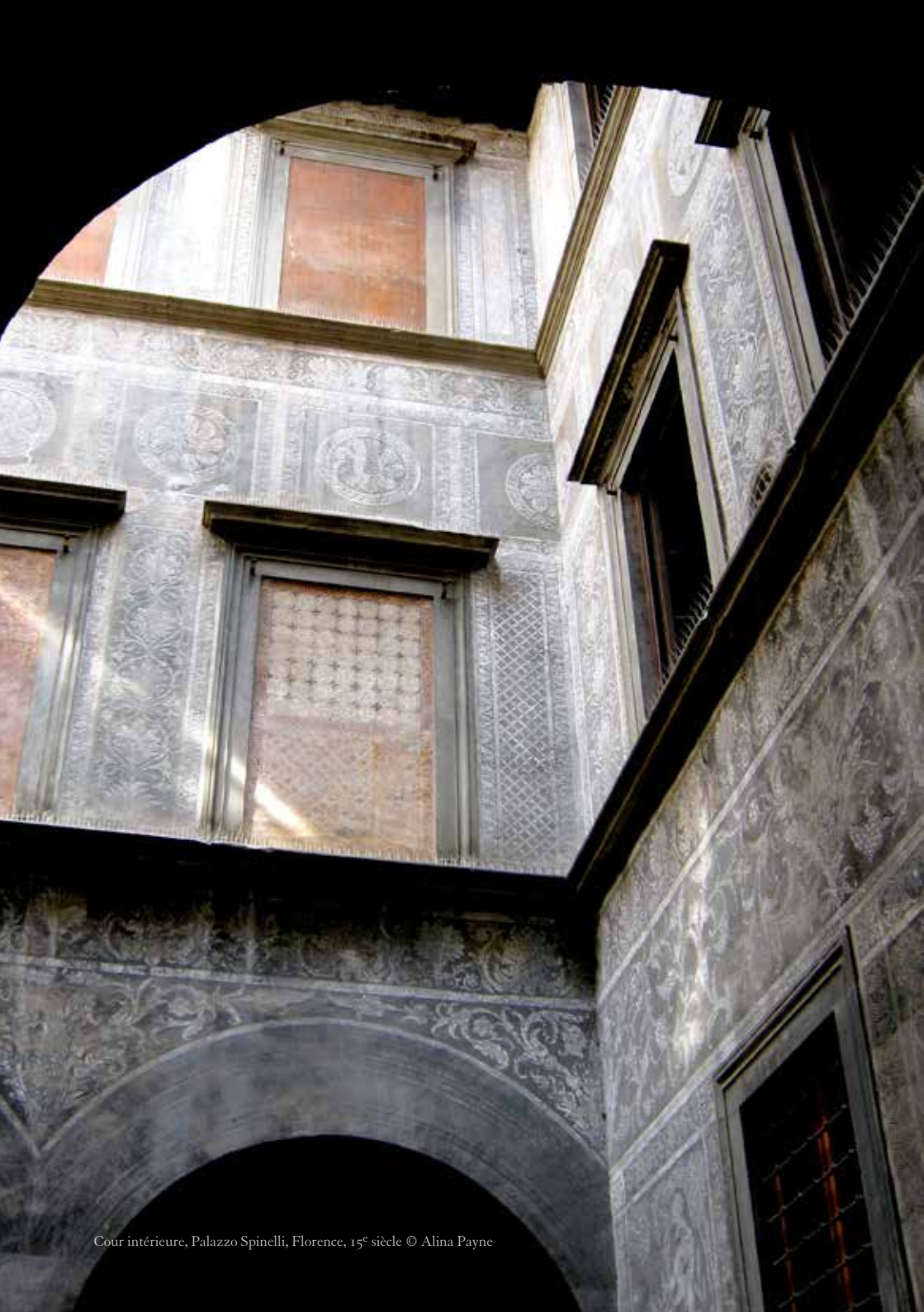
Cour intérieure, Palazzo Spinelli, Florence, 15 e siècle