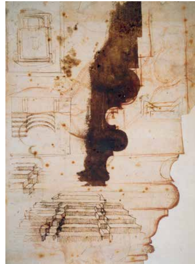
Michelangelo Buonarroti, Étude pour la bibliothèque Laurentienne (Biblioteca Medicea Laurenziana), Florence, Casa Buonarroti, inv. 92A recto.